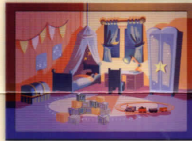
Детская комната (можно осмотреться)