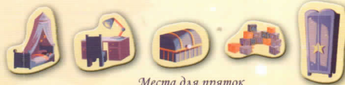
Места для прятков